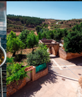
Arriba, foto de la localidad de Mora de Rubielos; debajo, un hombre haciendo unas migas. En la foto de al lado, la localidad de La Puebla de Valverde, y a la derecha, un rico plato de setas guisadas, propias de esta época.